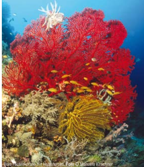
Rote Fächerkoralle mit Haarsternen.

So liegen gleich neben dem langen Korallenriff in der Sandbucht von Dauin die Tauchplätze „Car Wreck“ und „Banca Wreck“, die neben „People“ ganz oben auf der Favoritenliste der Taucher stehen. Hier sind regelmäßig schon bei nur einem einzigen Tauchgang verschiedene Garnelen- und Krabbenarten, mehrere Seepferdchen, Anglerfische, Geisterpfeifenfische und Nacktschnecken zu sehen. Die lokalen Tauchguides des Amontillado Resorts haben ein geschultes Auge und viel Erfahrung mit Fotografen und finden selbst das skurrilste und am verstecktesten lebende Meerestier. Nicht nur für Fotografen ein Erlebnis. Zu den Besonderheiten unter den Critter-Begegnungen gehören zum Beispiel auch Flügelrossfische, Pracht-Sepien und der eher seltene Mimik-Oktopus. Für Tauchgänge zur Dämmerung kennt man hier Plätze, an denen sich Mandarin-Leierfische bei der Paarung beobachten lassen.