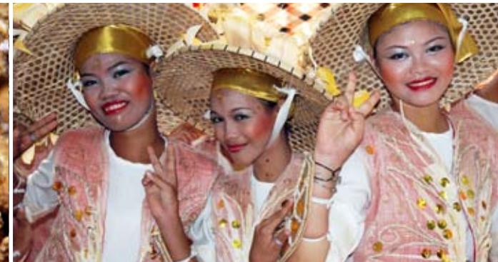
Philippinische Frauen beim Tanz

Verfügung, zum kleineren, nur einen Meter tief, gehört eine kleine Felsformation mit Wasserfall – hier lässt es sich herrlich entspannen. Tiefen-Entspannung findet im haus-eigenen Spa statt. Geschultes Personal sorgt mit Massagen nach Thai-Art, Shiatsu, Reflexzonen- und schwedischen Öl-Massagen für das absolute Wohlbefinden. Zudem werden Maniküre, Pediküre sowie Foot-Spa angeboten.