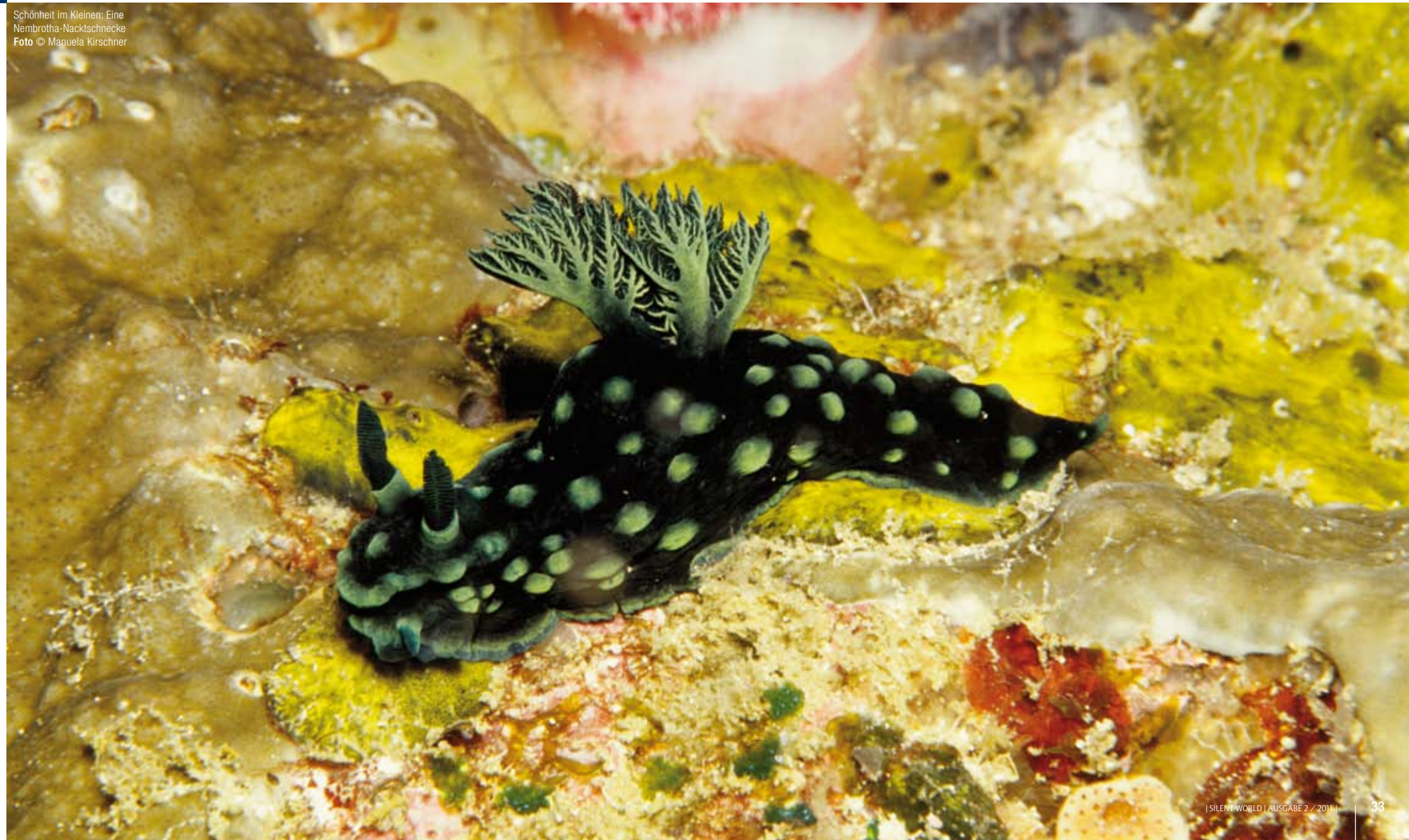
Schönheit im Kleinen: Eine Nembrotha-Nacktschnecke

DIE RIFFHÄNGE SIND BEDECKT MIT ÜPPIGEN KORALLENGÄRTEN: ORANGEROTE FÄCHERKORALLEN UND WEICHKORALLEN IN PINK, ROSA UND BLASSGELB SORGEN FÜR FARBE.