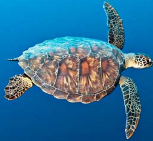
Meeresschildkröten schwimmen bei Apo Island und anderen Tauchplätzen regelmäßig vorbei.

Das war nicht immer so. Früher war das Riff um Apo Island durch intensiven Fischfang, besonders auch durch Dynamitfischerei, geschädigt, der Fischbestand dramatisch reduziert. Dann starteten Wissenschaftler der Silliman University Marine Laboratory aus dem nahe gelegenen Dumaguete eine Initiative. Unter Einbeziehung der Inselbewohner von Apo Island, fast durchweg Fischerfamilien, wurde daraufhin 1985 ein Meeresschutzgebiet geschaffen: das Apo Island Marine Sanctuary. Das von der Gemeinde organisierte Meeresschutzgebiet ist heute eines der besten Beispiele erfolgreicher Umweltschutzpolitik. Das Riff ist das pralle Leben und die Zahl der Fische hat sich vervielfacht.