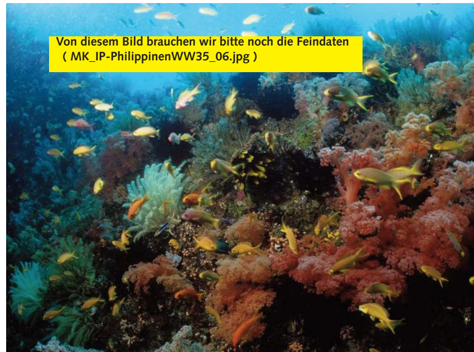
Von diesem Bild brauchen wir bitte noch die Feindaten ( MK_IP-PhilippinenWW35_06.jpg )